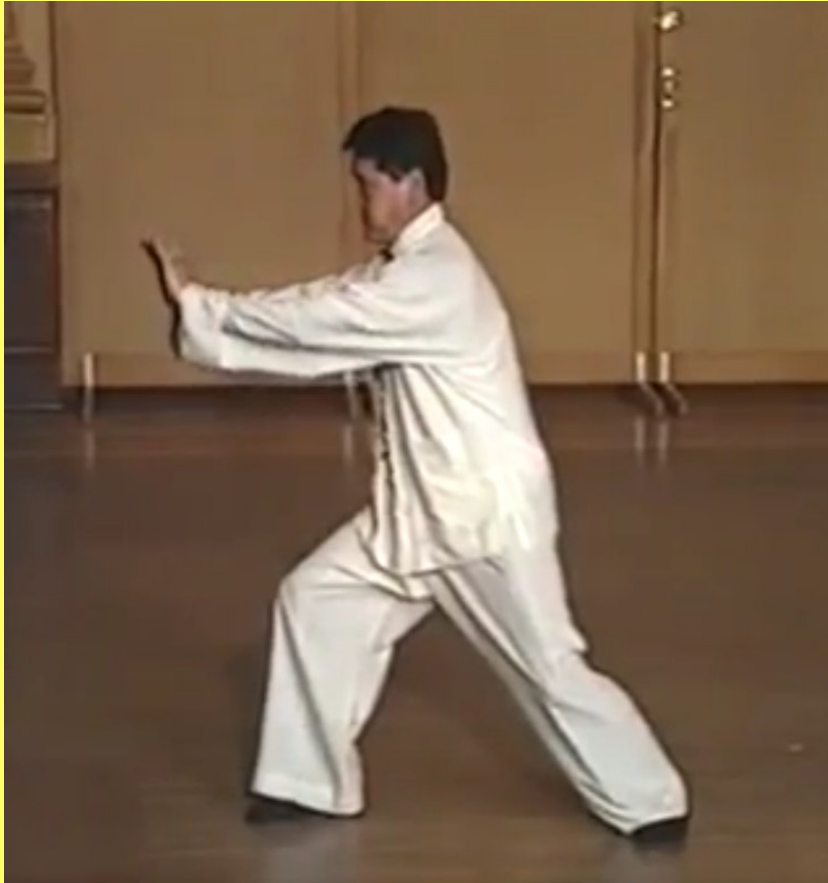
Fin du repousser